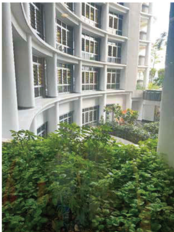
弧形結構使綠景更能一覽無遺